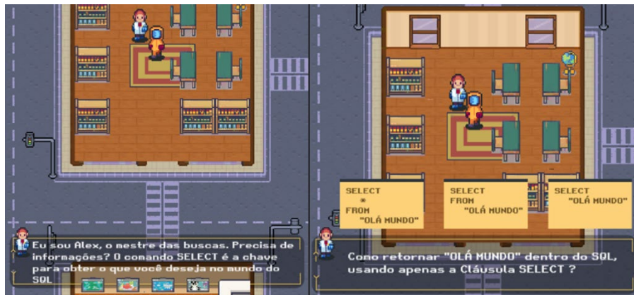
Figura 3 – Imagem da tela do jogador interagindo com outro NPC e jogador respondendo a um quiz de outro personagem

A inclusão de quizzes responsivos, nos quais as perguntas se adaptam ao nível de conhecimento do jogador e a fase que está incluído, proporciona uma avaliação constante no progresso do jogador, facilitando o monitoramento daquilo que foi aprendido. A fim de permitir que o jogador armazene conquistas e acessar informações sobre as sintaxes SQL adquiridas até certo momento, um menu em forma de agenda armazena tais informações e permite que o usuário tenha acesso no momento que desejar, como na Figura 4.