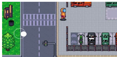
Figura 2 – Imagem representando a movimentação do jogador

Elementos de física como a movimentação do jogador feita por meio de Joystick, detecção de colisões e interações com o ambiente virtual, permite que o usuário se sinta livre em controlar o destino da história sem assimilar o jogo a um grande questionário. Na Figura 2 é apresentado um jogador se movimentando para a direita assim como a posição do Joystick o indicaria.